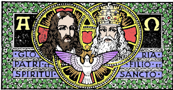
Respuesta a portada: Tres personas en un solo Dios. Respuestas a crucigrama: Horizontal: 3. AMO 6. ENVIO 7. JUZGAR 9. CREE 10. HIJO Vertical: 1. SALVE 2. UNIGENITO 4. PEREZCA 5. MUNDO 8. ETERNA

A veces podemos entender la Santísima Trinidad como si fuera una familia. Cada una de las personas es diferente, pero la familia no existiría realmente si faltara alguna de ellas. La Santísima Trinidad es también una relación de amor. Puesto que Dios está tan lleno de amor, quiso compartirlo con otros; ¡por eso nos creó! Cuando vivimos tal como Dios quiere que vivamos, nos unimos a la vida de la Santísima Trinidad. ¿Acaso no es asombroso?